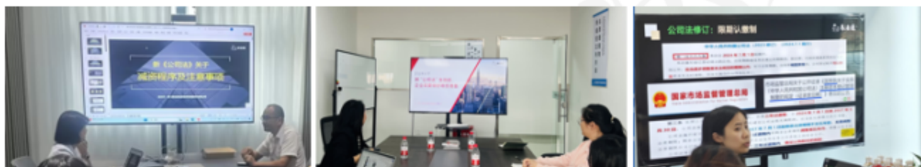
易法通·新公司法相关培训